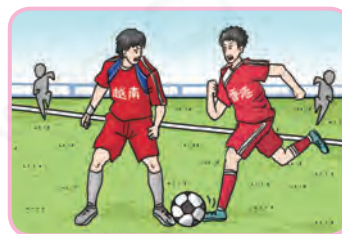
首屆亞洲杯足球賽於1956年9月1日至15日在香城舉行，香城代表隊獲得季軍