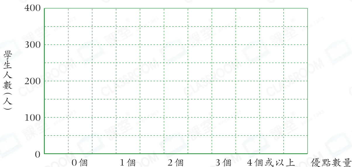
日昇小學學生上學期得到的優點數量