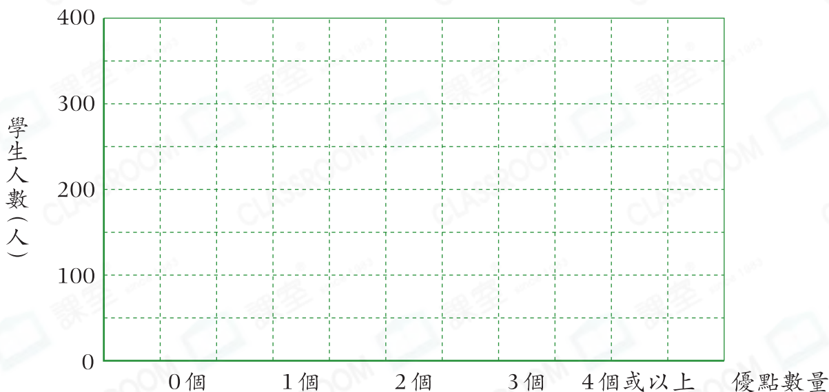
日昇小學學生上學期得到的優點數量