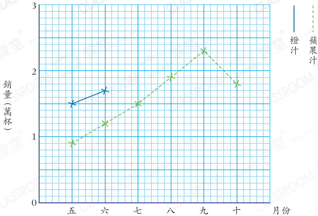
果汁店五月至十月的果汁銷量

5. 下表顯示果汁店五月至十月的橙汁銷量。把橙汁的銷量取近似值至千位，填在下表中。