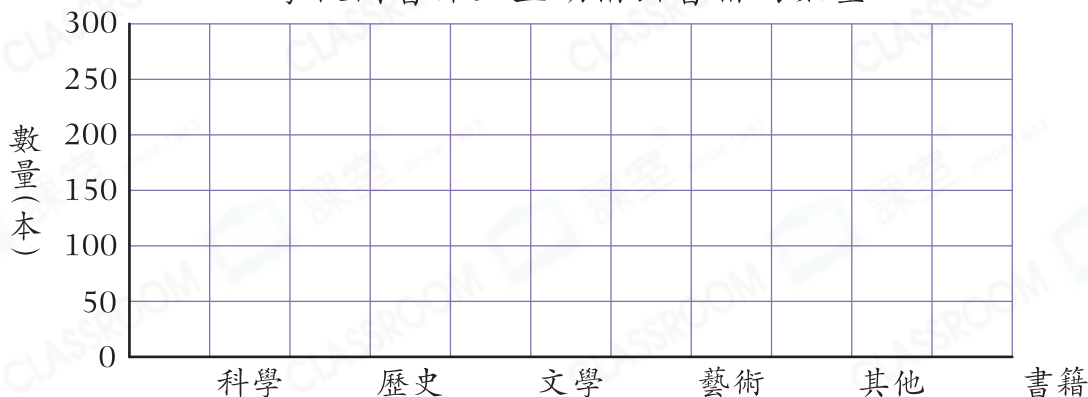
學校圖書館上星期借出書籍的數量