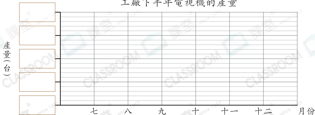
工廠下半年電視機的產量